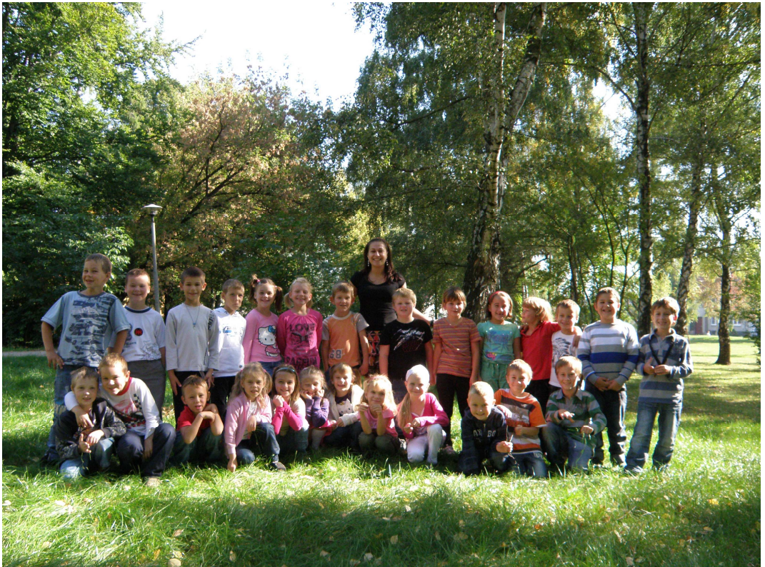
Žáci první třídy Základní školy Ořechov